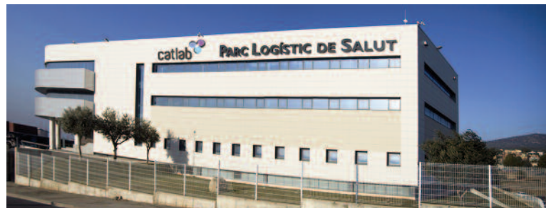
Edificio del Parc Logístic de Salut - CatLab

Efectivamente, mientras otros laboratorios tienen algunas determinaciones acreditadas, nosotros tenemos 900, lo que supone un 93% de los resultados que damos. Primero nos certificamos en ISO 9001, norma conforme a la que hemos implementado un sistema de gestión de calidad en nuestro laboratorio, pero nuestra gran diferencia al respecto de otros laboratorios es que además estamos acreditados en ISO 15189. Se trata de una acreditación específica para laboratorios que no es obligatoria en España para la actividad que desarrollamos, pero sí en Eu-